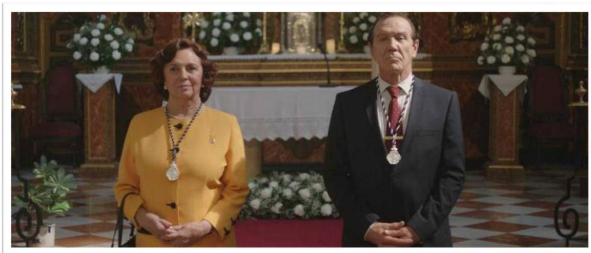
Gloria Muñoz y Juan Gea, en “Mi querida cofradía”.